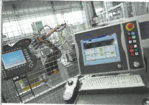
Die Wilhelm Humpert GmbH & Co. KG ist seit 1918 in Wickede (Ruhr) beheimatet.